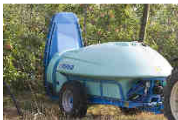
Auch mit vertikaler Luftführung.